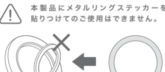
メタルリングステッカー